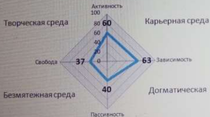
Графическая модель соотношения типов образовательной среды

Преобладает карьерно-догматическая среда, которая способствует формированию АКТИВНОГО , но... ЗАВИСИМОГО и ПАССИВНОГО типа личности